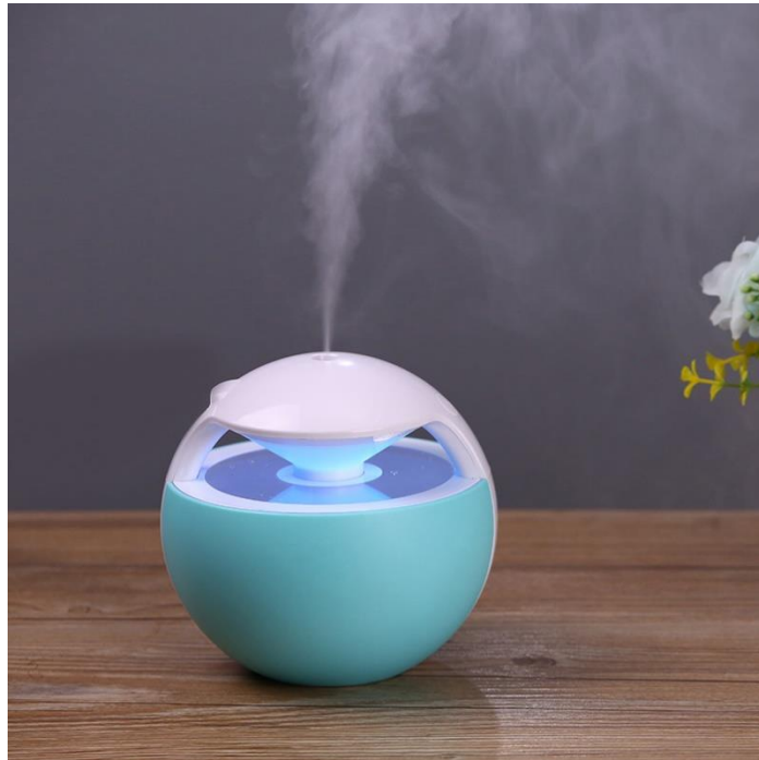
Figura 3. "Producto terminado con propósitos de humidificar/aromatizar el ambiente"

Humidificador que cuenta con un generador de niebla en su interior: