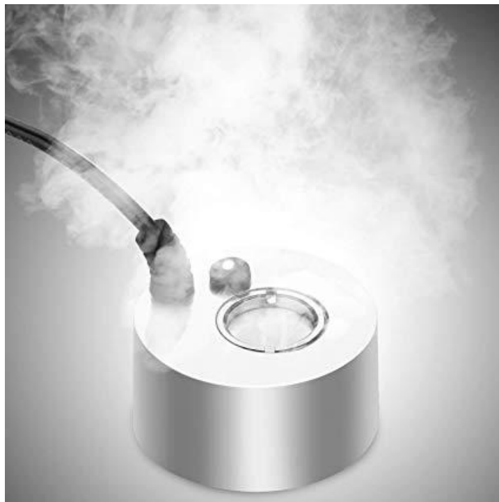
Figura 2. "Generador de niebla que puede ser empleado para cualquier tipo de propósito (decoración)"

Generador de niebla para propósito general: