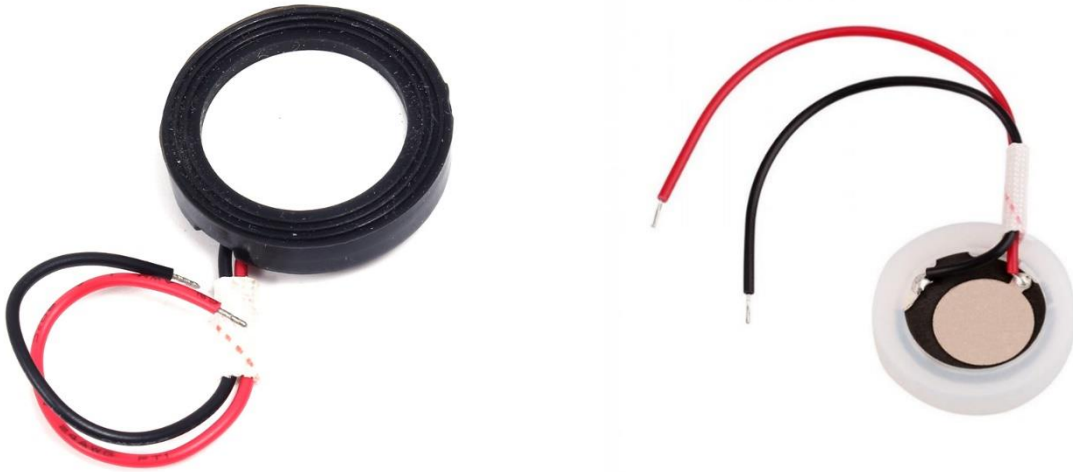
Figura 1. "Componentes discos cerámico de reemplazo para Mist Maker"

Generador de niebla para propósito general: